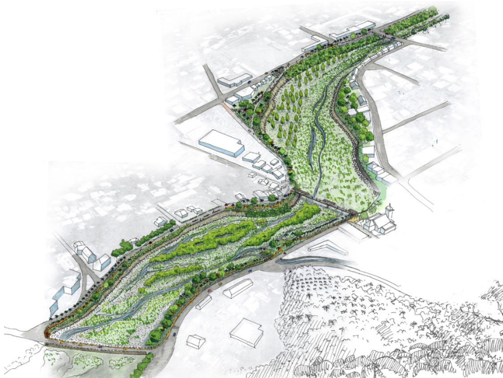
Vue aérienne aménagement